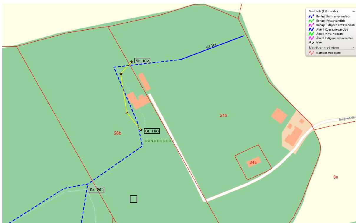
Figur 2. Forlægning af delstrækning af kommunevandløb nr. 61 Ravnsborg fra st. 102 til st. 168, markeret med gul streg